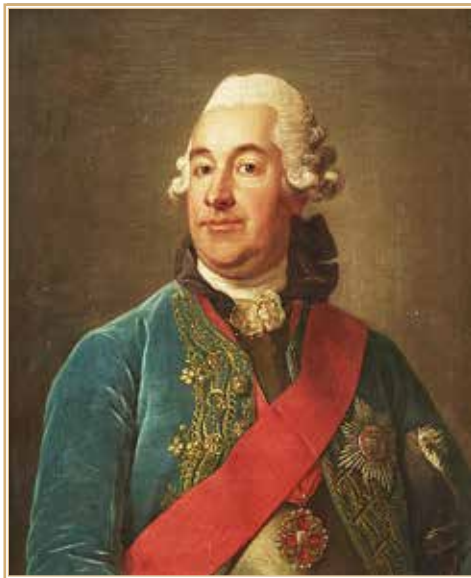
Иван Андреевич Остерман. Худ. Пер Крафт Старший. Из открытых источников

рия обрела доступ к Черному морю, сформировав условия для развития политико-экономических проектов в Средиземном море. Историк Г.А. Гребенщикова отмечает, что «Петербургская система международных отношений» стала общепризнанным фактором европейской политики 16 . В инструкции графу С.Р. Воронцову излагалась официальная позиция, объясняющая причины присоединения Крымского полуострова в 1783 г. 17 Интеграция данных территорий ожидаемо стала предметом озабоченности великих держав. Усиление России в черноморском регионе обусловило конфликт ее внешнеполитических интересов с устремлениями Великобритании и Франции, боровшихся за контроль над стратегически важным перекрестком евразийской коммуникации 18 .