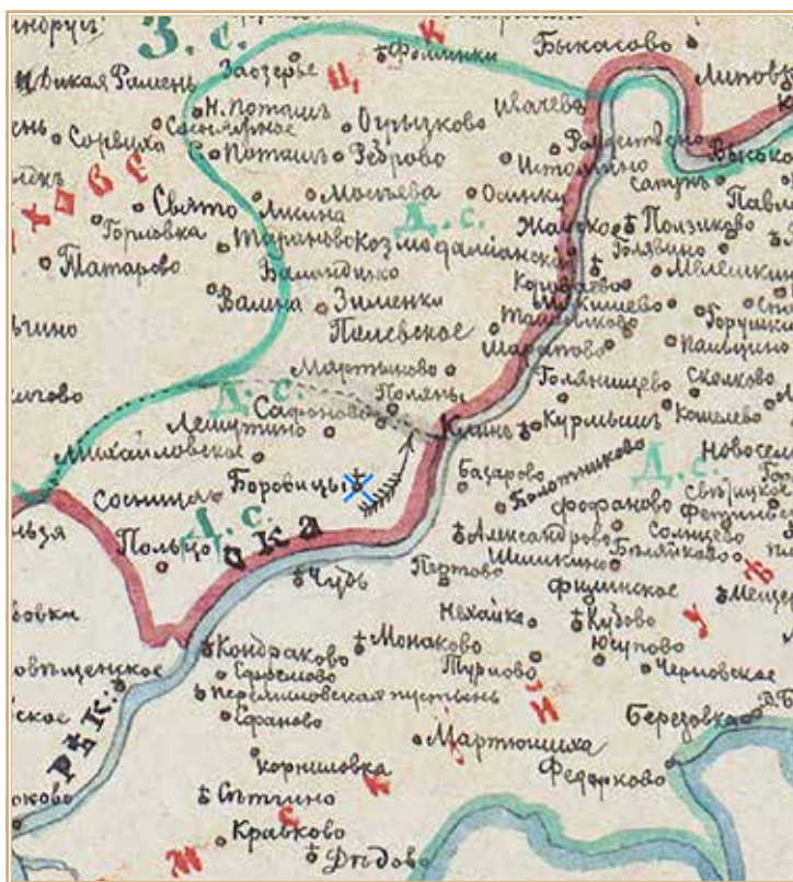
Село Боровицы на карте Древне-Муромского уезда 1676 г. http://www.etomesto.ru/map-vladimir_drevne-muromskiy-1676/ ?y=55.800331&x=42.359313

(Боровичах) Муромского уезда 58 . Ныне это село Боровицы Муромского района Владимирской области.