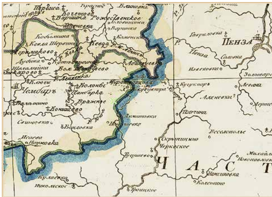
Село Вражское (Враское, Врацкое, Архангельское, Чанбар, Михайловка тож) на карте Тамбовской губернии из атласа Вильбрехта. 1800 г.

http://www.etomesto.ru/map-tambov_tambovskaya-gub-1800/