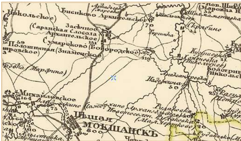
Село Сумароково (Богородское тож) на специальной карте Западной части России Шуберта 1826–1840 гг.

Численность населения села Сумароково (Богородское тож) показана в таблице 42 :