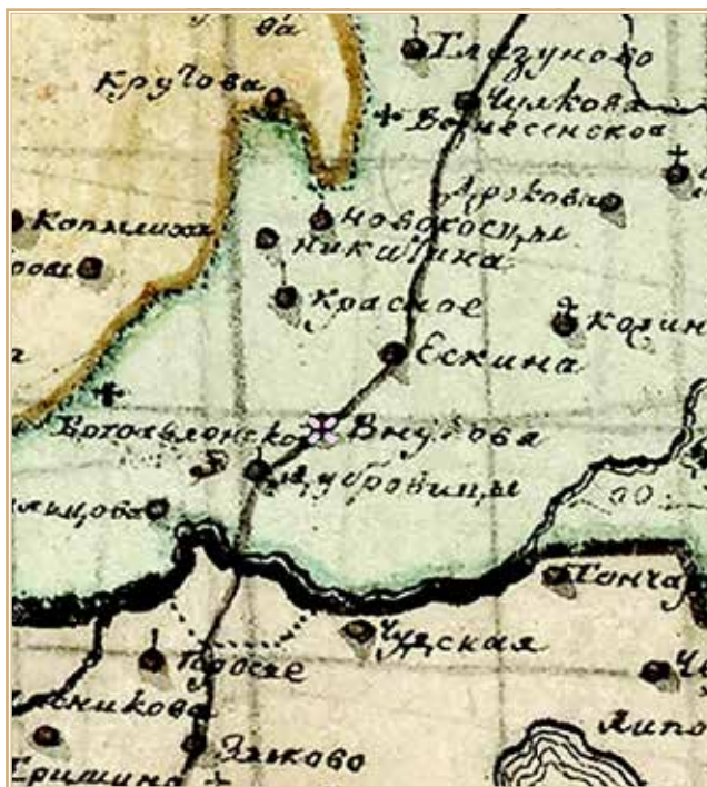
Деревня Внуково на Генеральной карте Владимирской губернии 1802 г. http://www.etomesto.ru/map-vladimir_guberniya-1802/?y=56.044021&x=42.462694