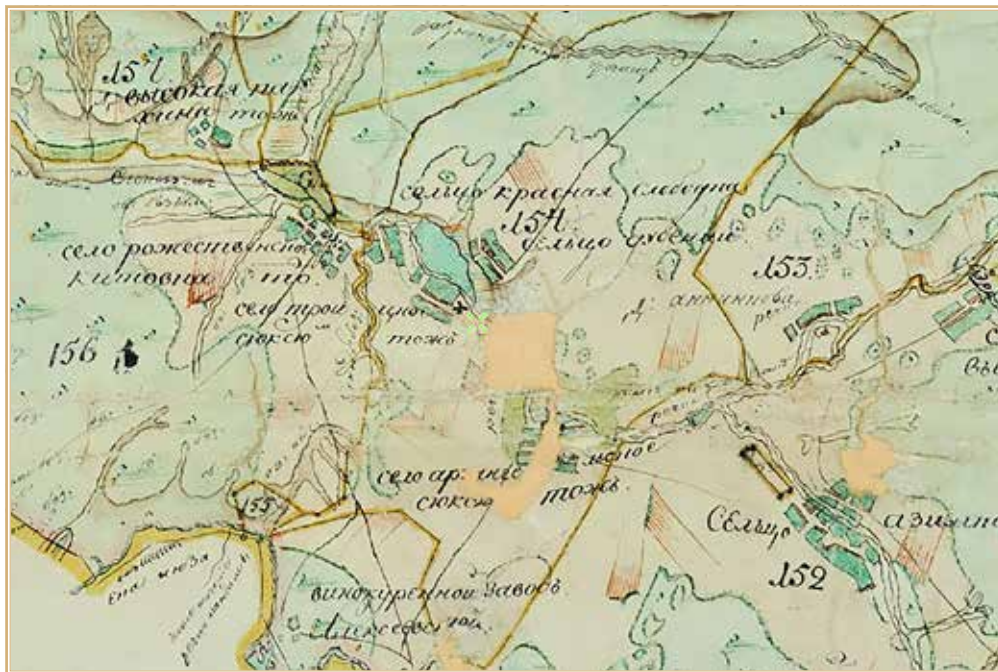
Село Троицкое (Суксюм тож) и селцо Красная Слободка на Плате генерального межевания Карсунского уезда Симбирской губернии. 1807 г. http://www.etomesto.ru/map-ulyanovsk_pgm-karsunskogo-uezda/