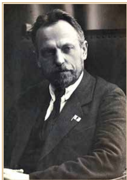
Николай Александрович Семашко.

больницу для всесторонних клинических исследований и наблюдения на предмет установления точного диагноза и рассмотрения чрезвычайно серьезного вопроса о показании к оперативному вмешательству. До нового постановления консилиума больной должен находиться в больнице без выхода» 5 . Это означало, что он не мог принять участие в работе пленума ЦК РКП(б), который открылся 3 октября. Возражать Фрунзе не мог после принятия выше цитированного постановления Политбюро.