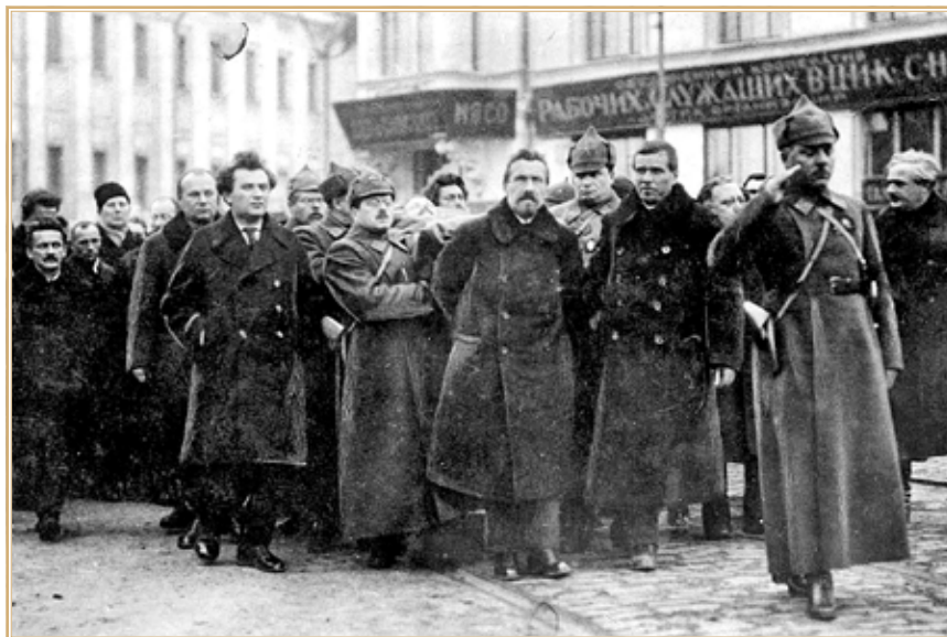
Похороны Фрунзе.

бюро. Конечно, не просто переизбрать, а расширить, т.е. дополнить... Как мы к этому отнеслись? Отвергли — и больше ничего» 58 .