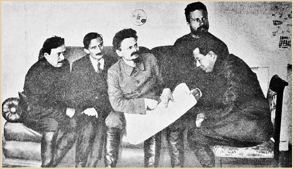
Бела Кун, Жак Садуль, Лев Троцкий, Михаил Фрунзе, Сергей Гусев.

лектива подчиняет себе человеческие индивидуальности, и о том, как благие пожелания в нашей российской действительности очень часто превращаются в катастрофические непоправимости, ...злобствовал я только против врачей» 27 . Независимо от того, что он лукавил, в его объяснении было много справедливого.