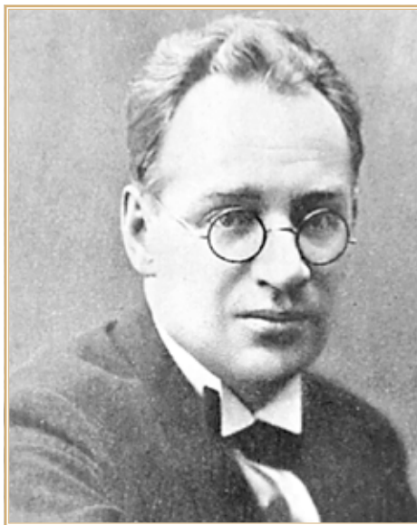
Борис Андреевич Пильняк (Бернгард Вогау). Из открытых источников

неудачных случаев» 22 . В качестве примера такого случая приводилась смерть крупного партийного и государственного деятеля председателя Центральной ревизионной комиссии РКП(б) и председателя Всероссийского текстильного синдиката В. Ногина. Он несколько лет страдал от болей в области желудка, был установлен диагноз «язва двенадцатиперстной кишки» в еще более тяжелой форме, чем у Фрунзе. 17 мая 1924 г. Розанов провел ему операцию, но через 5 дней Ногин умер от воспаления брюшины. Безусловно, хирург помнил о таком исходе и потому пытался отсрочить операцию Фрунзе. Вероятно, и Сталин помнил о кончине Ногина после необходимой ему операции.