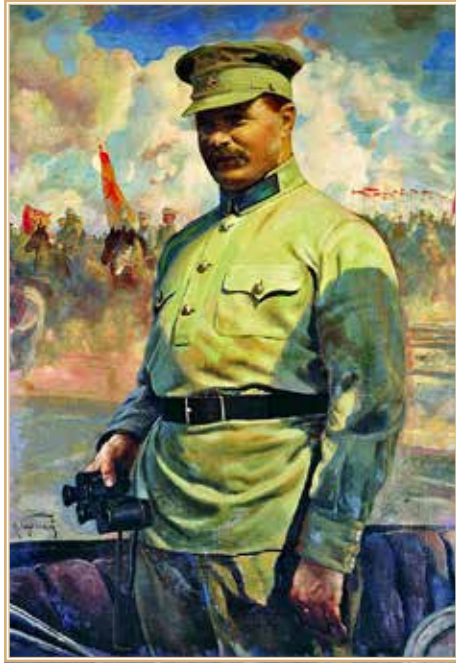
М.В. Фрунзе на маневрах. Худ. И.И. Бродский.

Центральный музей Вооруженных сил Российской Федерации. Москва